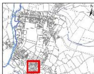
2 rue Bourg-le-Comte Plan de situation en 1811