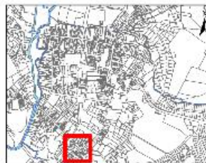
2 rue Bourg-le-Comte Plan de situation en 1990